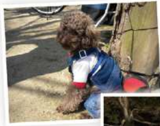
お散歩 大好きだワン!

自慢のペットと楽しく散歩している 写真を始め、グラウンドゴルフや茶道、 ダンスなどの趣味を楽しんでいる 皆様の写真を大募集!!