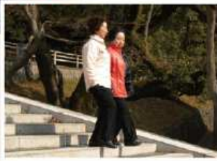
階段も こわくない!!