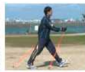
ポールを斜め後ろに突く

前号では、ポールを持った時に自然に腕を振るコツを紹介しましたね。自然な腕振りですけるようになったら、次はしっかりと地面に突いて押しながら歩いてみましょう。 ぽと同じなので、意識してみてください。また、ポールの突き押しを意識しすぎると、ぎこちない歩き方になります。前号で紹介したようにポールを引きずりながら腕を前後に振って歩き、自然に腕が振れてきたら、徐々に突き押しを意識すると、スムーズにできるはずですよ。ご自分のペースで練習してみてくださいね。 過去連載内容は、ワダカルショップ（ホームページ）で閲覧頂けます。