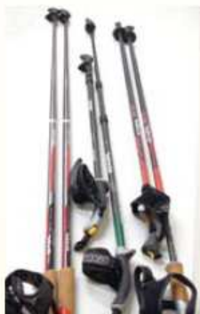
ノルディックウォーキングに欠かせないポール

方へ押し出され、歩幅が広がり、歩行ペースが自然に速くなります。このように、ノルディックウォーキングでは、ポールを縦や前方に突くことによりブレーキとして使うのではなく、斜め後方に突くことによりアクセルとして利用します。このため、ノルディックウォーキングのポールには様々な工夫がされています。