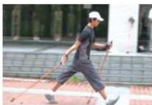
ポールで膝や足にかかる負担を軽減

皆さんは、山登りをしたときにポールを突いて歩いている人を見かけたことがあるでしょうか。ポールは、上りでは体重を上へ押し上げるために使われ、下りでは体重を支えるために使われます。どちらにしても、山登りでは、ポールは足腰への負担を減らす道具として利用されています。では、ノルディックウォーキングではどうでしょうか？