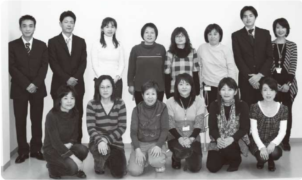
ワダカルシウム製薬通信販売部は 今年もみなさんの健康を応援して参ります