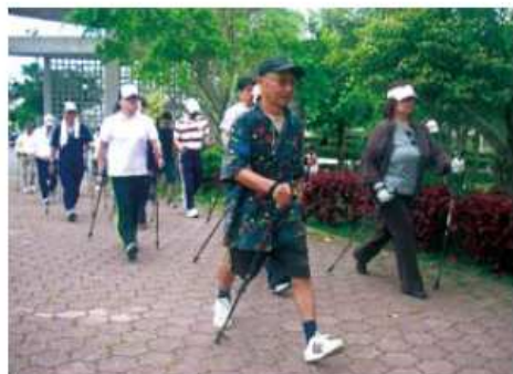
腕の運動にもなり、エネルギー消費量アップ！