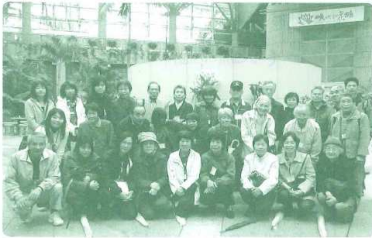
たくさんのお客様にお集まりいただきました！

今までお顔を拝見することのなかったお客様とお会いすることができ、ワダカルスタッフも大興奮。とても楽しい2時間でした。